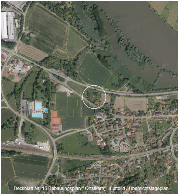
Deckblatt Nr. 15 Bebauungsplan „Ortskern“ - Luftbild / Übersichtslageplan