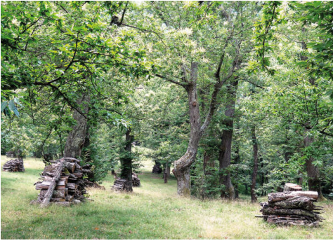
Bewirtschaftete Selve in den Cévennes.

Viele der heute nicht mehr bewirtschafteten Selven am Taunushang sind noch vorhanden: Kastanienhaine, verdichtet und durchwachsen von jüngeren Ess-Kastanien, dazwischen aber auch noch ab und an einzelne über 300-jährige Zeitzeugen. Auch in den bewaldeten Berghängen hinter dem Heidelberger Schloss stehen noch immer zahlreiche Ess-Kastanien, die während der Blütezeit im Frühsommer schon von Weitem zu sehen sind.