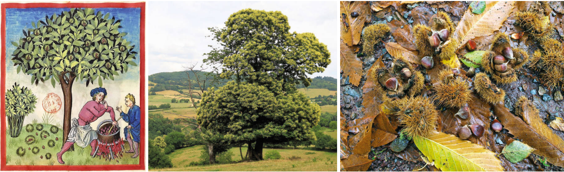
v. li. nach re.: Mittelalterliche Darstellung Tacuinum / Ess-Kastanie in der Bourgogne. / Herbst.

Erfahrungen mit der Kultivierung von Ess-Kastanien zur Gewinnung der Früchte und sie kannten die Vorteile des gegen Verrottung erstaunlich resistenten Kastanienholzes im Weinbau. Zu Hause in ihrem Stammland hatten sie daher sowohl Früchte liefernde Kastanienhaine als auch Kastaniengehölze, aus denen sie das Holz für die Rebstöcke, Rankhilfen, Pfähle und Fassdauben holten. Beides – Kastanienkulturen und Weinanbau – hat daher dank der Römer an den Hängen des Oberrheins, der Nahe, der Mosel und der Saar eine rund zweitausendjährige gemeinsame Geschichte, die erst in den letzten 150 Jahren nach und nach zu Ende gegangen ist. Rebstöcke sind heute meist aus Metall, Beton oder Plastik, Fässer aus Stahl oder Kunststoff. Und die Kastanienfrüchte kommen heute größer und billiger vorwiegend aus Italien, Frankreich, Spanien und der Türkei.