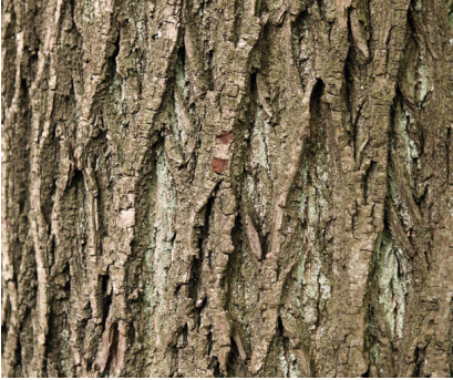
v. li. nach re.: Blätter. Foto: H.J. Arndt / Weiblicher Blütenstand. Foto: R. Kubosch / Fruchtstände. Foto: A. Roloff / Borke. Foto: H.J. Arndt