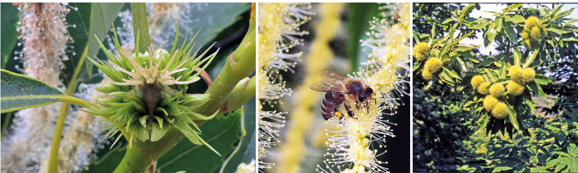
v. li. nach re.: Weiblicher Blütenstand. / Beides geht: Insekten- und Windbestäubung. / Fruchtstände kurz vor der Reife.

Honig ist ein nicht unwesentliches Nebenprodukt dieser Selven. Die oft in geradezu verschwenderischer Fülle die gesamte Krone überziehenden Blüten der rund 30 Tage lang blühenden Ess-Kastanie sind ausgesprochen nektarreich. Der Honig ist dunkel bernsteinfarben, hat einen sehr aromatischen, leicht herben Geschmack und ist überaus pollenreich.