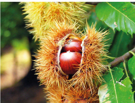
Reifer Fruchtstand mit Nussfrüchten.

Als Maronen werden meist die Früchte bestimmter Ess-Kastanienarten bezeichnet, die besonders groß sind. Oft enthält der stachelige Fruchtkorb solcher Sorten statt üblicherweise drei nur eine einzige Frucht. Deren braune Schalen sind in der Regel heller, oft auch hell und dunkel gestreift. Ein ganz wichtiges Kriterium ist auch, dass die geschmacklich störende innere Samenhaut nicht in die Spalten des Kerns eingewachsen ist. Sie lässt sich daher leicht entfernen. Der Begriff Marone wird allerdings nicht in allen Herkunftsländern einheitlich benutzt.