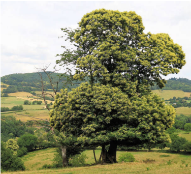
Ess-Kastanie Bourgogne.