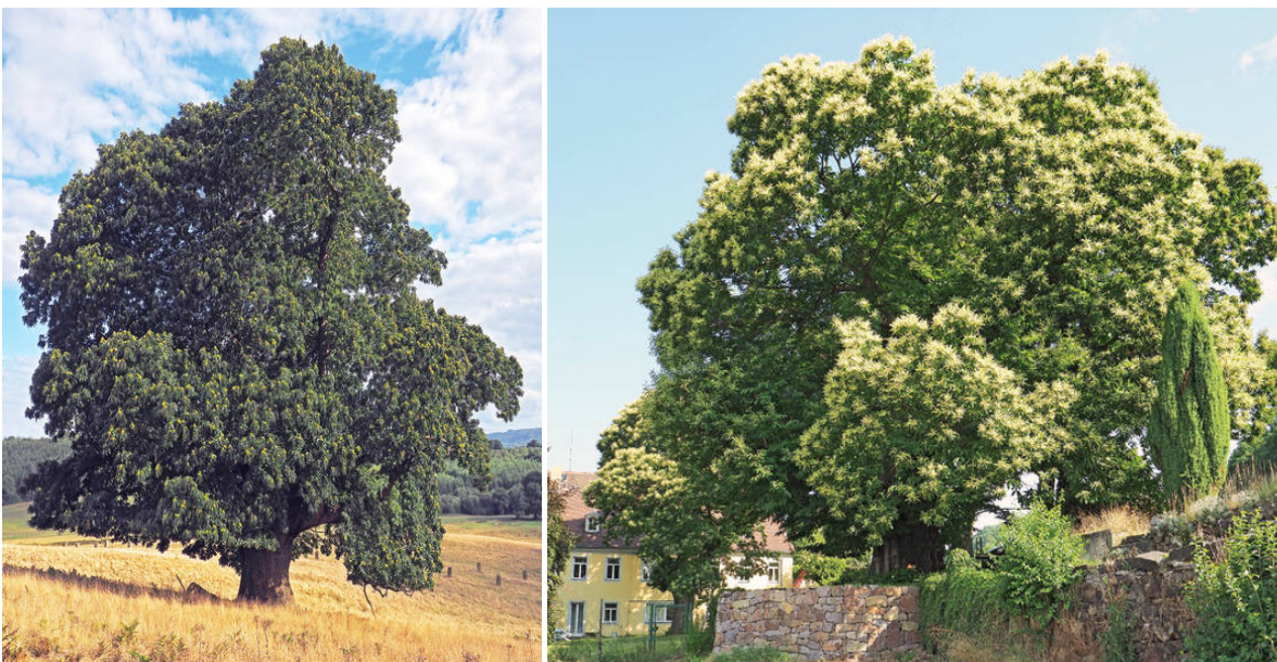
links: Ess-Kastanie / rechts.: Alte Ess-Kastanie auf einem ehemaligen Weingut bei Radebeul.

Wer es dann noch versteht, aus diesen Kastanien Suppen, Bratenfüllungen, Süßspeisen, Torten, Brot oder schlicht „Heiße Maroni“ zu fabrizieren, der zählt diesen Baum bestimmt schon längst zu seinen Lieblingsbäumen.