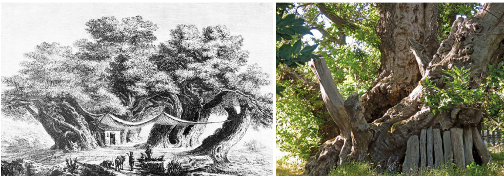
links: Kastanie der 100 Pferde um 1880 / Abb. rechts: Kastanie der 100 Pferde heute – eines der noch verbliebenen drei Stammfragmente.

Tatsächlich gibt es so einen Baum, bei dem sich dieser Zyklus so einige Male wiederholt haben muss. Er steht auf Sizilien nahe des Ortes Sant' Alfio am Osthang des Ätnas und wird auf ein Alter von mindestens 2000 Jahren geschätzt. Er besteht heute nur noch aus drei einzelnen, aber nahe beieinander stehenden Stammfragmenten, von denen allein der mächtigste einen Umfang von 22 Metern hat. Schilderungen und Darstellungen aus früheren Jahrhunderten zeigen, dass dieser Baum aus einem Ring mehrerer, mehr oder weniger miteinander verwachsener Stämme bestand, in dessen Inneren allein etwa 30 Pferde Platz finden konnten. Eine andere mittelalterliche Geschichte erzählt, dass die Königin von Aragon samt ihrer Entourage von 100 Reitern bei einem plötzlichen Gewitter unter der Krone dieses Giganten Schutz gefunden habe. Aufgrund dieser Legende trägt der Baum heute den Namen Castagno dei cento Cavalli. Er hatte 1780 – als noch alle Stammteile vorhanden waren – einen Umfang von über 60 Metern und wäre damit wohl der dickste Baum der Welt gewesen.